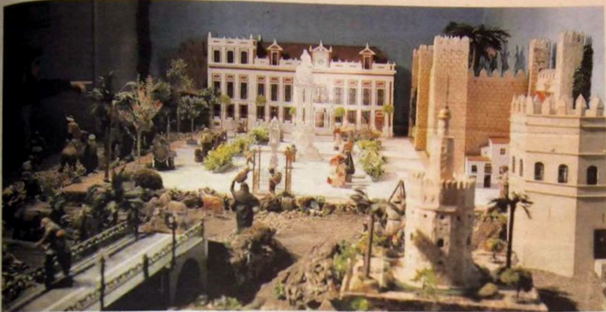
Belén de la Solidaridad, instalado en el Convento de Santa Rosalía