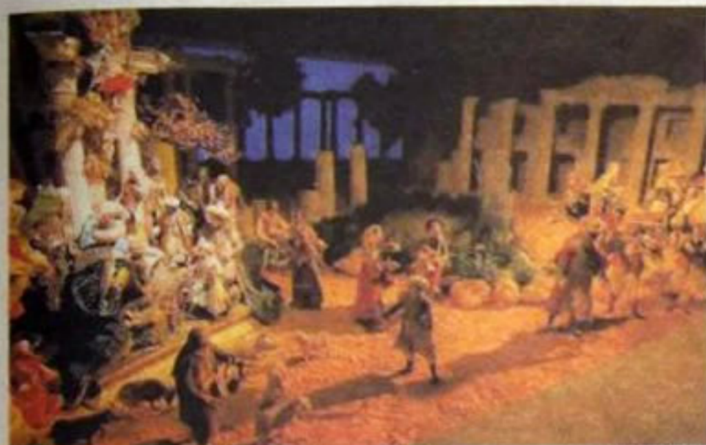
Belén napolitano con figuras del siglo XVII